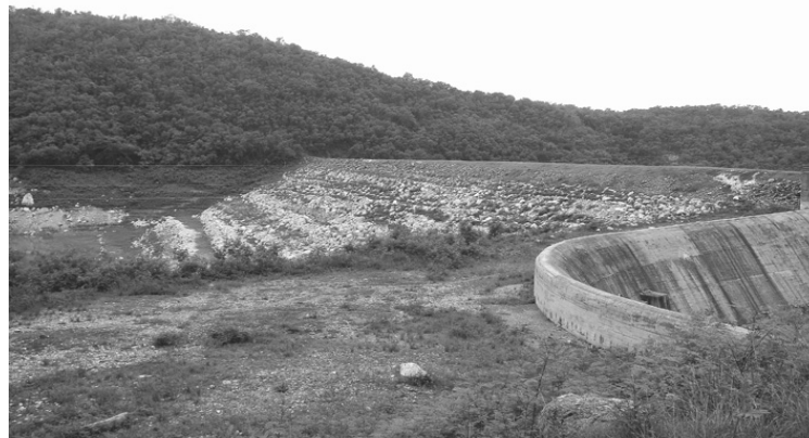
La presa Corrojo, en Guisa, con capacidad para 96 millones de metros cúbicos, está prácticamente seca

Extensa es aún la relación de estaciones de bombeo afectadas, de manera parcial o total, por la sequía en Granma, lo que obliga a distribuir agua en pipas a una numerosa población.