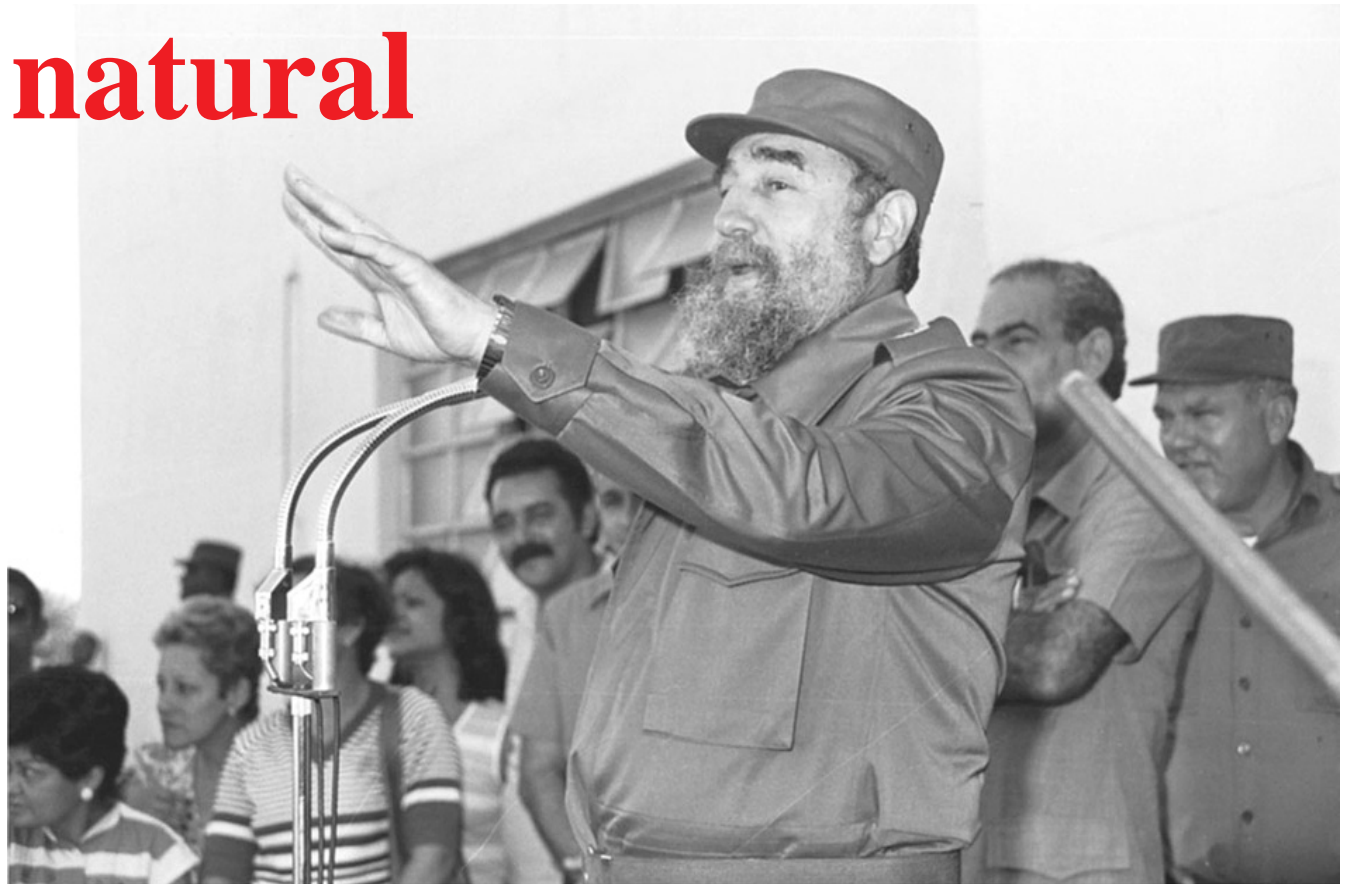
Habla al pueblo de Bayamo, desde la Unidad gráfica José Joaquín Palma, el 20 de diciembre de 1986

Hasta en el mismísimo Estados Unidos, durante su visita a ese país en abril de 1959, muchos fueron a conocerlo. En 1979, volvió, como Presidente del Movimiento de Países No Alineados, y en el vuelo alguien le preguntó si llevaba chaleco antibalas. El Gran David de América Latina se desabrochó parte de la camisa,