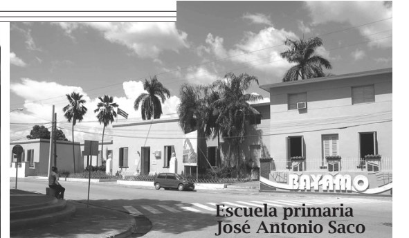
Escuela primaria José Antonio Saco