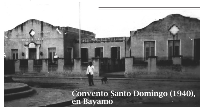
Convento Santo Domingo (1940), en Bayamo