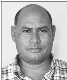
Bismar Pérez Ayala, servicio, turismo, consumo y economía