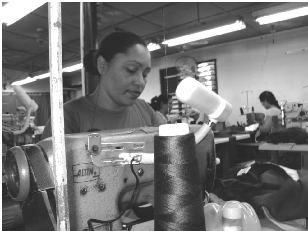
Isabel reconoce que desde que comenzó a aplicarse la Resolución 17 ha mejorado la economía de su familia

Igualmente, se incrementó el salario promedio, de 432 a 837.84, en el cual influye no tener pérdidas, una motiva-