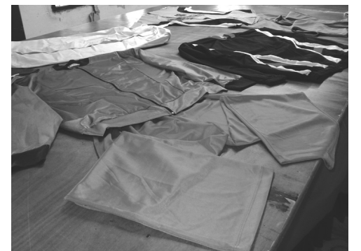
Muestra pequeña de las producciones de la Industria Deportiva

está al tanto de lo que necesitamos, claro, con lo que tiene a su alcance.