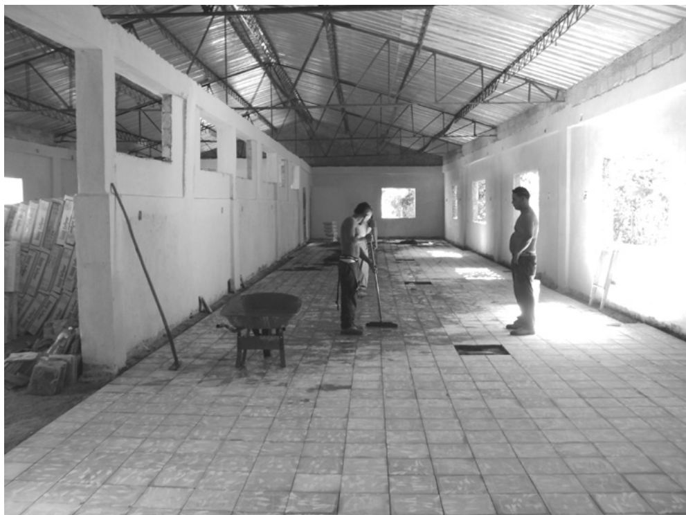
El taller que se construye puede estar listo para el 19 de Noviembre, Día de la Cultura Física y el Deporte, cuyas actividades centrales en la provincia ganaron los boyarribenses

Ahora, con 21 años de experiencia, reconoce que es "tremendo avance; además, la dirección se preocupa, siempre