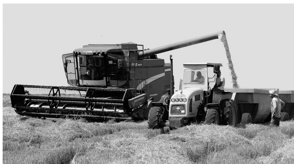
La intensa sequía afectó considerablemente la producción de arroz

Los grupos de control de la legalidad aseguran la integración de las instituciones, las organizaciones y los órganos de enfrentamiento a la actividad delictiva, que refleja los índices