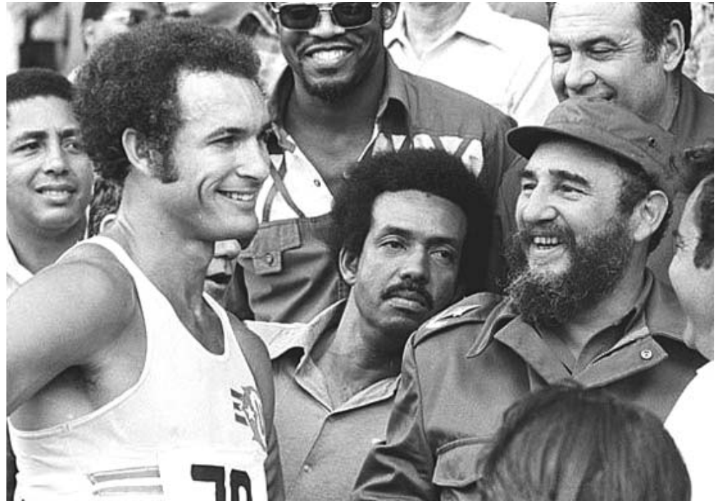
Juantorena y Fidel comparten sonrisas

Su presencia en los escenarios de competencias, como sucedió en los XI Juegos Panamericanos La Habana'91, en la despedida y bienvenida a delegaciones que participaron en torneos internacionales, sirvieron de estímulo al pujante movimiento atlético cubano, pues ningún país bloqueado económicamente, hostigado, agredido, "...hizo por el deporte ni alcanzó los logros que, en un brevísimo período hizo y alcanzó Cuba".