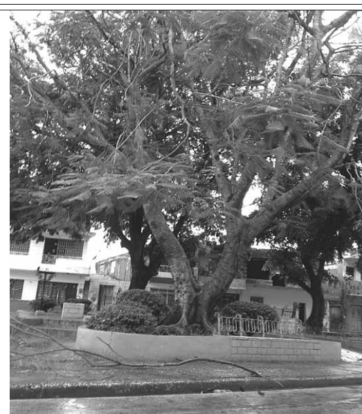
Las lluvias en Bayamo van mutilando el árbol del parque La Ollá, dañado severamente por el comején