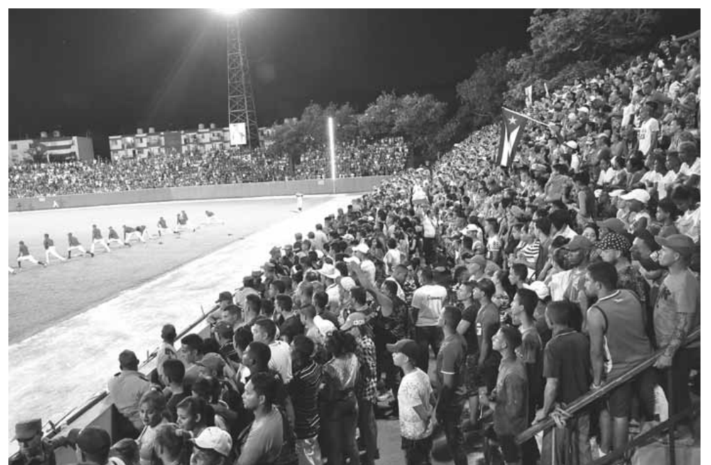
La afición granmense respalda a su equipo