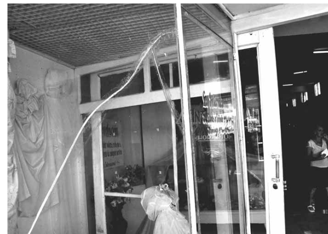
Las vidrieras quebradas no solo dañan la imagen de las tiendas, sino que pueden provocar un lamentable accidente. Tienda La Internacional, en el Paseo bayamés de General García