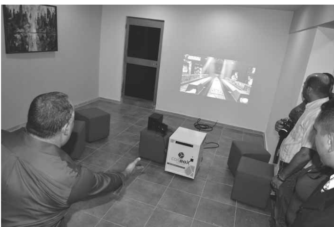
El bayamés ciber-bar Don Juan cuenta con servicios gastronómicos y juegos computarizados, además de conexión wifi