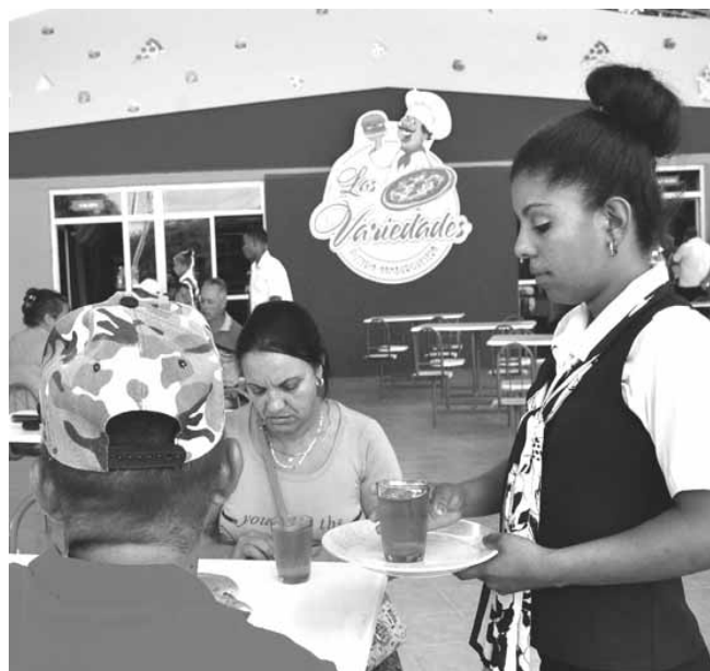
En la unidad Las Variedades, de Bayamo, se incrementó el servicio con la oferta de pizzas, espaguetis, además, de las tradicionales hamburguesas