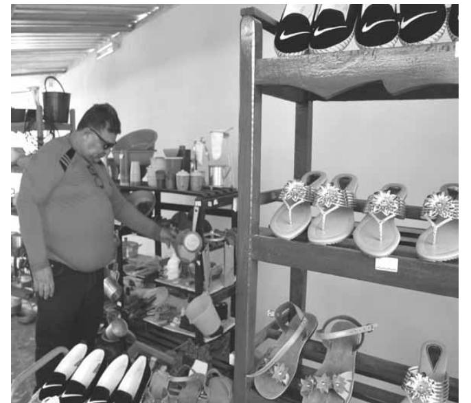
En la céntrica calle Céspedes, de Niquero, comenzó a prestar servicios El Bazar, espacio destinado a los trabajadores por cuenta propia, quienes comercializan productos útiles del hogar y personales