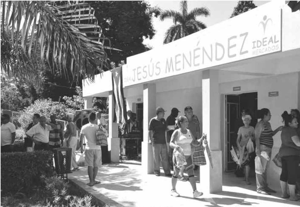
Nuevos locales en el mercado Ideal, de Jesús Menéndez, de Bayamo, favorece la venta de productos