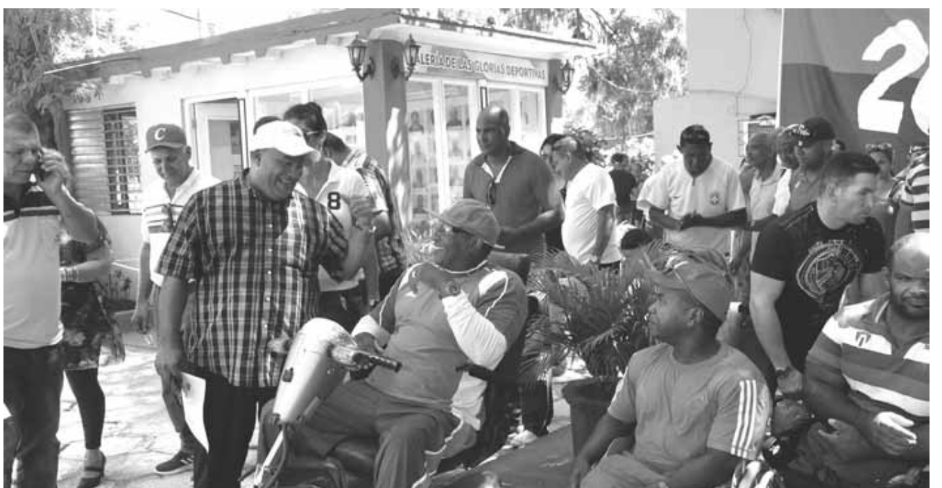
La galería de las glorias deportivas y figuras relevantes fue inaugurada en el estadio Mártires de Barbados, de Bayamo