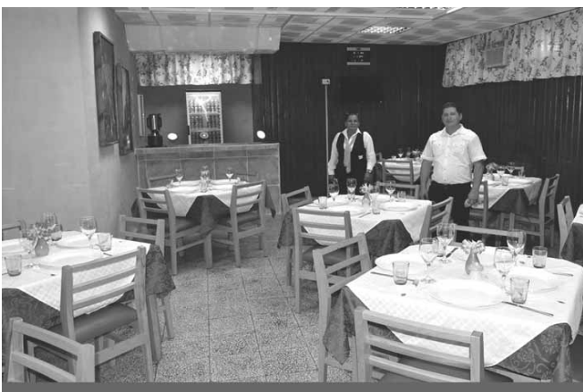
La reapertura del restaurante de la Facultad de Medicina Celia Sánchez Manduley, de Manzanillo, ahora con una cafetería, permitirá atender a cerca de 200 comensales diariamente