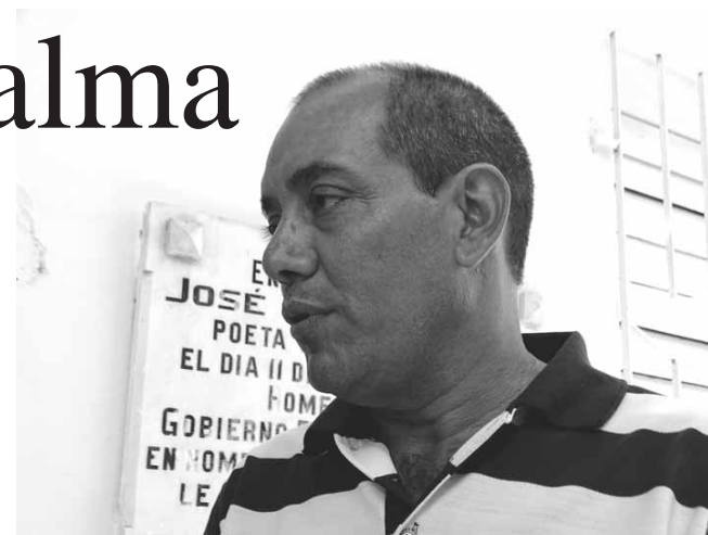
Ludín recibirá el lauro durante la Fiesta de la cubanía, en octubre próximo

Otros textos lo constituyen Bayamo (2005), Francisco Vicente Aguilera. Proyectos modernizadores en el valle del Cauto (2009), Fidel Castro Ruz, Itinerarios por la provincia Granma (2006), Francisco Salgado y el espiritismo de cordón en Cuba (2016), entre otros, que incluye seis de carácter histórico y más de una veintena de artículos en revistas especializadas.