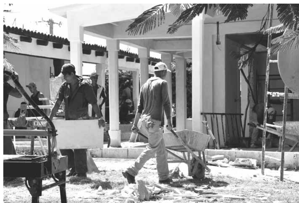
En La Demajagua se vive un ajetreo incansable

La Ciudad del Golfo de Guacanayabo se transforma poco a poco, y sus hijos son los principales protagonistas.