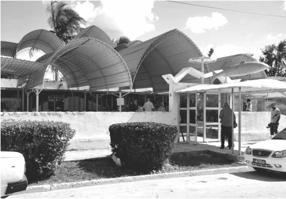
La Lisetera, un sitio emblemático