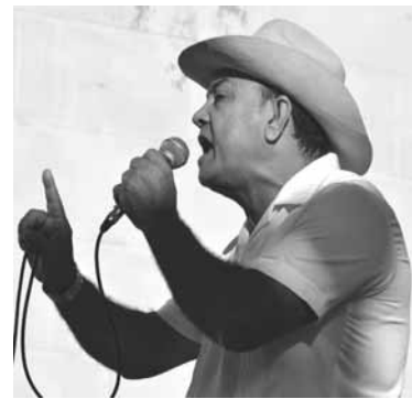
El punto cubano logró su espacio dentro de la Fiesta de la cubanía

Entre las actividades más importantes, figuran la Fiesta del aliño, idea del cantautor Raúl Torres, concierto con el Quinteto Rebelde, presentación del grupo Moncada, recorrido de la Guerrilla de Teatros por Campechuela y el Primer clásico regional de repentismo Mi tierra es Así.