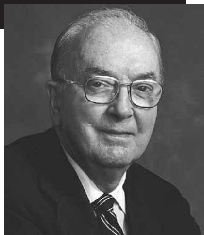
Jesse Alexander Helms Jr.

Título IV: “Exclusión de determinados extranjeros”. Impide el visado o excluye de territorio estadounidense a las personas y familiares que “trafiquen” con propiedades norteamericanas. Ya se ha aplicado selectivamente para presionar a varias compañías a retirar sus negocios de Cuba.