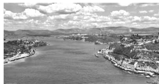
Puerto de Santiago de Cuba

Bajo el amparo de esta ley, ya aparecieron los supuestos dueños