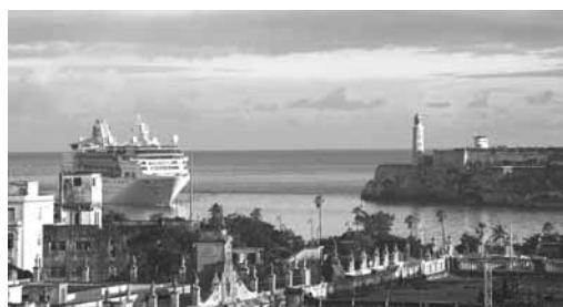
Puerto de La Habana

El segundo, furibundo anticomunista, mantuvo vínculos estrechos con los escuadrones de la muerte de El Salvador; se opuso a los tratados Torrijos-Carter, que devolvía el canal a Panamá. Apoyó las dictaduras militares latinoamericanas, especialmente la de Augusto Pinochet, en Chile. Mostró su rechazo a los ideales del líder de los derechos civiles Martin Luther King a quien tildaba de “marxista”, a los homosexuales y a otras minorías. Intentó colocar al VIH como enfermedad excluyente para entrar a Estados Unidos, un dislate en el que fracasó.